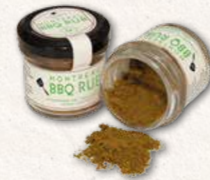
Montreal BBQ Rub