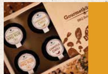
Gourmet-Gewürze ab Seite 38