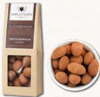
GLÜCKSBINGER Trüffelmandeln mit Kakao Eine unserer beliebtesten Snack-Kompositionen

Ein Mandelkern, umhüllt von feinsten belgischer Schokolade, bedeckt mit einem Hauch Kakaopulver. Die Kombination aus feinerherbem Kakao mit zartschmelzender Schokolade und einer knackigen Mandel ist einfach unwiderstehlich.