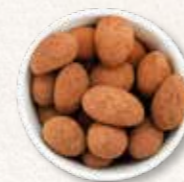
Trüffelmandeln mit Kakao