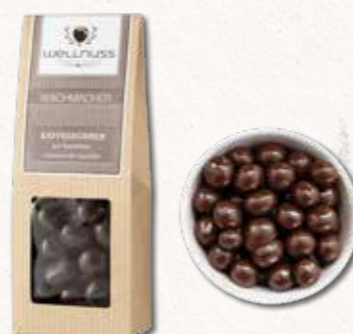
WACHMACHER Kaffeebohnen in Zartbitterschokolade Hallo-Wach-Kick auf süße Art und Weise

Der herbe Matcha harmoniert perfekt mit der Süße weißer Schokolade und der leicht bitteren Mandelnote. Ein Snack, der Ihnen eine Entscheidung von vornherein abnimmt: ob Sie ihn vernaschen sollten.