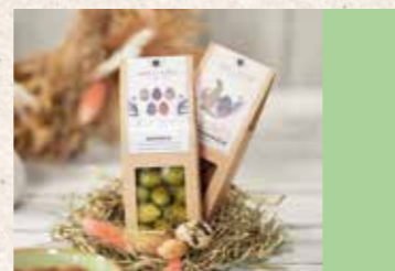
Ostern ab Seite 4