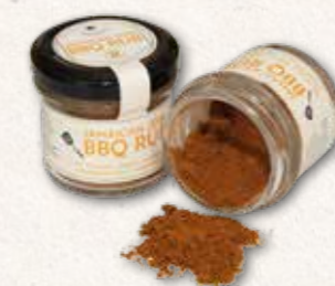
Jamaican Jerk BBQ Rub