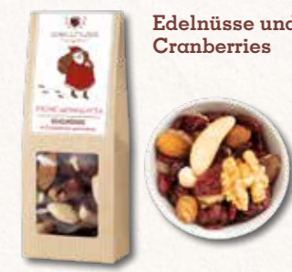
Edelnüsse und Cranberries