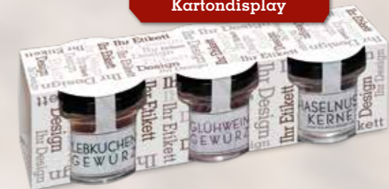
Kartondisplay mit Weihnachts- gewürzen im Glas ab Seite 46

Ab 100 Stück mit Ihrem Motiv auf dem Kartondisplay