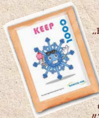
„BLEIB COOL IM KOPF“