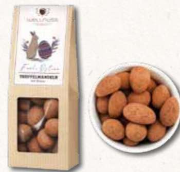
TRÜFFELMANDELN MIT KAKAO Eine unserer beliebtesten Snack-Kompositionen Ein Mandelkern, umhüllt von feinsten belgischer Schokolade, bedeckt mit einem Hauch Kakaopulver. Die Kombination aus feinerherbem Kakao mit zartschmelzender Schokolade und einer knackigen Mandel ist einfach unwiderstehlich.