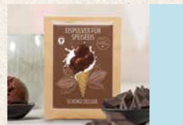
Eis zum Selbermachen ab Seite 30