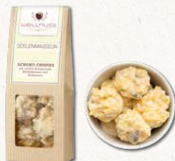
SEELENMASSEUR Schoko-Crispies mit weißer Schokolade Balsam für die Seele

Ein Mandelkern, umhüllt von feinsten belgischer Schokolade, bedeckt mit einem Hauch Kakaopulver. Die Kombination aus feinerherbem Kakao mit zartschmelzender Schokolade und einer knackigen Mandel ist einfach unwiderstehlich.