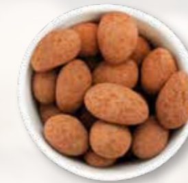
Trüffelmandeln mit Kakao