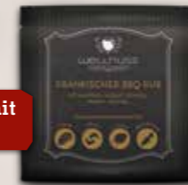
Portionsbeutel Seite 40