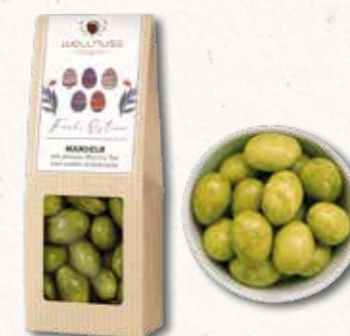
MANDELN MIT GRÜNEM MATCHA-TEE UND WEISSER SCHOKOLADE Natur in ihrer edelsten Form Der herbe Matcha harmoniert perfekt mit der Süße weißer Schokolade und der leicht bitteren Mandelnote. Ein Snack, der Ihnen eine Entscheidung von vornherein abnimmt: ob Sie ihn vernaschen sollten.