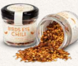
Birds Eye Chili