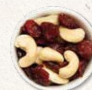
Cashewkerne & Cranberries