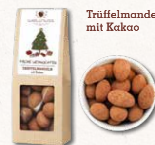
Trüffelmandeln mit Kakao