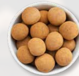
Haselnuskerne mit Vollmilch & Zimt