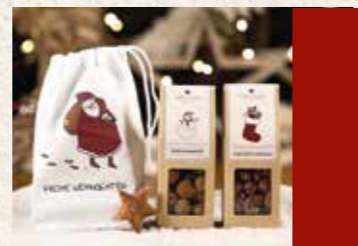
Weihnachten ab Seite 6