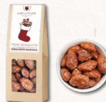
GEBRANNT E MANDELN MIT EINEM HAUCH ZIMT Klassiker vom Weihnachtsmarkt Der leichte Karamelduft versetzt Genießer direkt auf den Weihnachtsmarkt. Ein Klassiker mit herrlicher Süße und knackigem Biss.