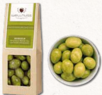
ENTSCHEIDUNGSHelfER Mandeln mit grünem Matcha-Tee und weißer Schokolade Natur in ihrer edelsten Form

Über knackige Haselnüsse spannt sich ein Mantel aus belgischer Schokolade, bestäubt mit feinstem Zimt. Ein Mix aus zartem Aroma, süßem Schmelz und herrlichem Knack.