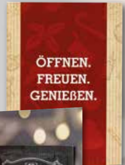
Gourmetkästchen Seite 48