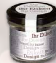
Gourmet Gewürz im Glas ab Seite 42

Ab 100 Stück mit Ihrem Motiv auf dem Kartondisplay