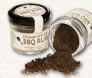
Fränkischer BBQ Rub