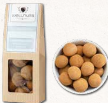
GLÜCKSKUGEL Haselnusskerne mit Vollmilch-Schokolade und Zimt Pures Glück aus Schokolade

Zartbitterschokolade für die Seele, Cashewkerne für den Crunch und ein gutes Gewissen, abgerundet durch die fruchtig-herbe Note der Cranberries. Ein ganz besonderes Geschmackserlebnis.