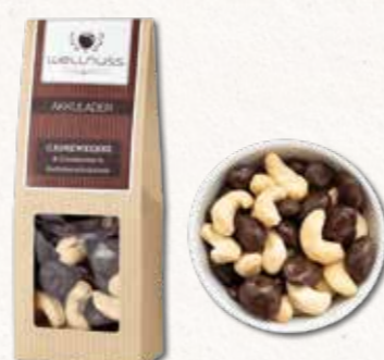
AKKULADER Cranberries in Zartbitterschokolade und Cashewkerne Doppelte Geschmackspower

Weiße Schokolade, Kürbiskerne, Kornflakes und Erdbeerstückchen – viele unserer Stammkunden sagen, den Spitznamen „Seelenmasseur“ trägt dieser Snack zu Recht.