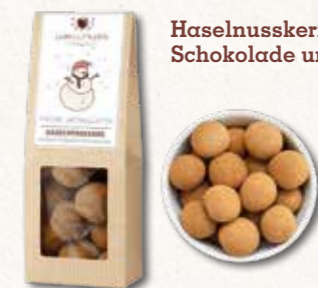
Haselnusskerne mit Vollmilch-Schokolade und Zimt